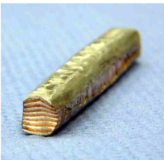
die kanten werden rund geschmiedet